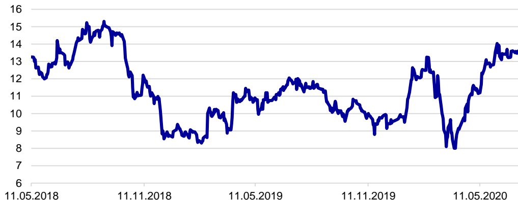
NFON (Xetra) in Euro